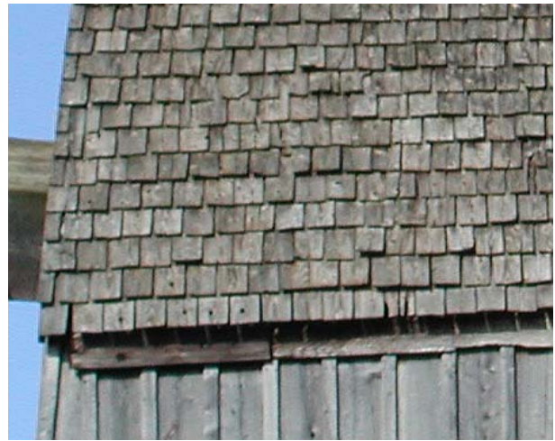
De nuværende savskårne spåner fra midten af 1900tallet.

I 1972-73 udskiftedes krydstømmeret i krydsfoden, og ås og vinger blev fornyet.