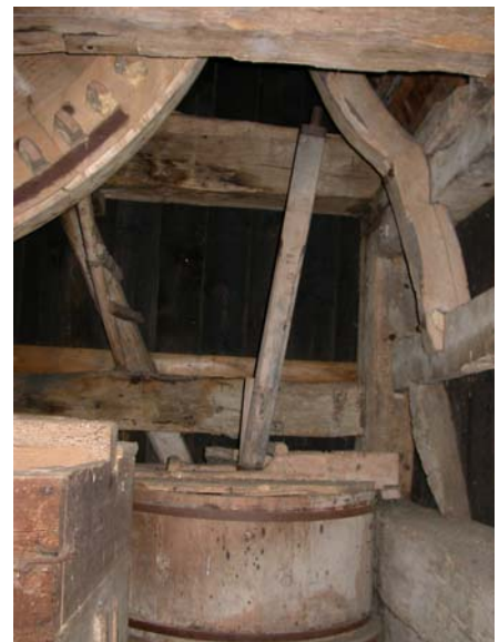
Den lille højre kværn, uden drev.