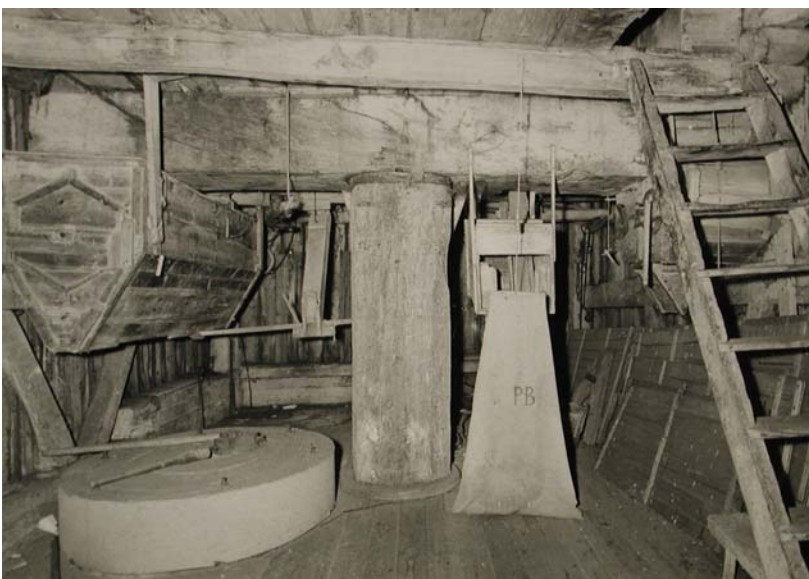
Skalkværnen er afmonteret, stenen bevaret. A. Jespersen 1957

Senere, formentlig omkring 1900 er skalkværnen afmonteret, stenen og bunden af kassen er dog bevaret. Desuden er drevet til en lille kværn fjernet.