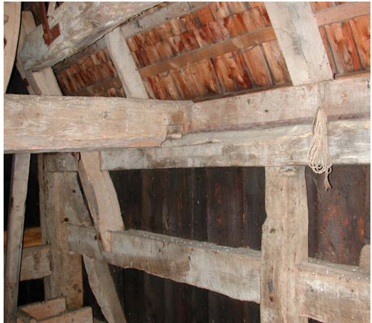
Forhøjelse med et tømmerstykke på remmen.

Senere, formentlig omkring 1900 er skalkværnen afmonteret, stenen og bunden af kassen er dog bevaret. Desuden er drevet til en lille kværn fjernet.