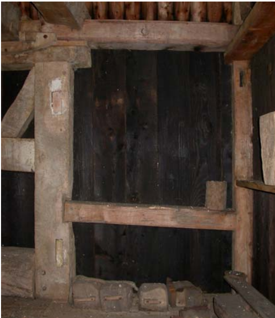
Forlængelse bagud på "lægavlen"

Man ser at at møllen er forlænget med 115 cm bagud og ca. 25 cm på fronten, og det betød samtidig at åsen formentlig blev udskiftet med en længere. Ligeledes er svansen forlænget, og møllen er desuden forhøjet en lille smule, idet der er lagt et tømmerstykke ovenpå remmene til bæring af tværstykke for spilstokken til den store kværn. Også hathjulet kan være fornyet. Endelig er en kværn på kværnloftet kommet til, og skalkværnen på broloftet., remsemaskine og gryntromle, samt sigteværk.