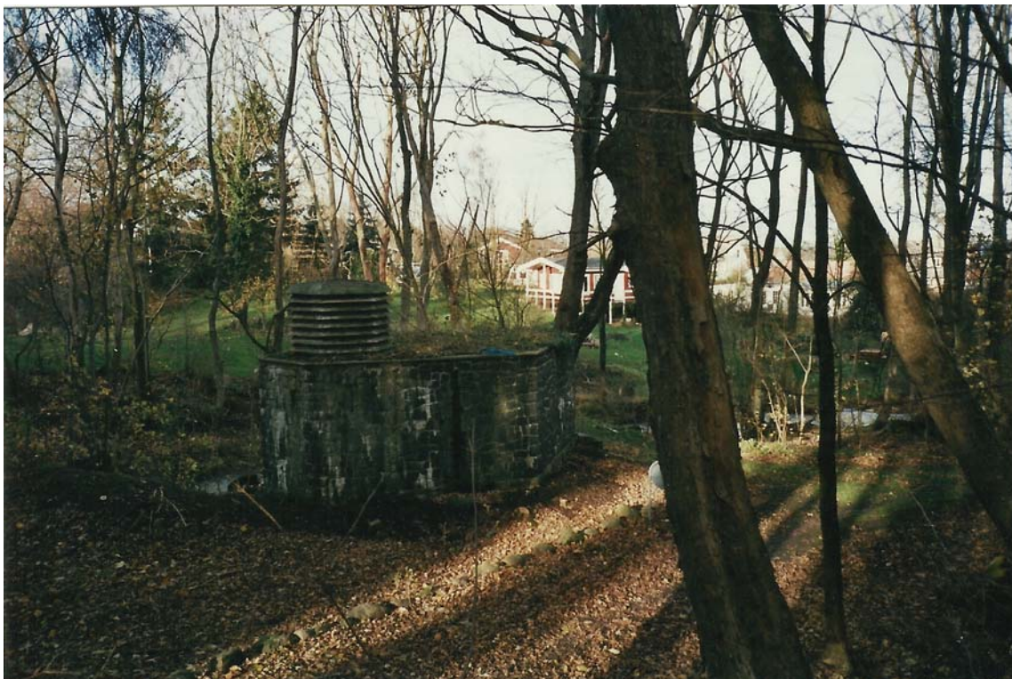
Svaneke Vandværk & Pumpestation ved Vaseåen

På Svaneke Vandværk & Pumpestation, der også ligger øst for Vaseåen blev vandet behandlet, - det vil sige, at det blev iltet i bygningens iltningstårn så f.eks. evt. jernforbindelser i vandet kunne udfældes, herefter blev vandet ledt igennem et sandfilteranlæg. Derefter fortsatte vandet, der nu var rent drikkevand - ned i Svaneke Vandværks rentvandsbeholder, der ligger under bygningen - en slags kælder.